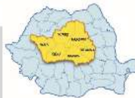
Localizarea Regiunii Centru